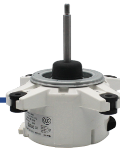
ІНВЕРТОРНИЙ ДВИГУН ВЕНТИЛЯТОРА

Спеціальне гідрофільне покриття завдяки якому швидко акумулюється тепло, та легко видаляється волога зовні, що підвищує ефективність нагрівання.