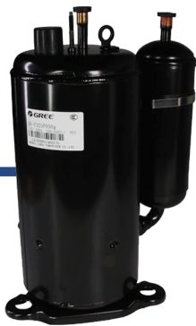
КОМПРЕСОР ІНВЕРТОРНОГО ТИПУ FULL DC

Технологія EVI та автоматичне перемикання в робочий режим нагріву або охолодження в залежності від температури навколишнього середовища. Стабільна робота навіть при -30\text{ }^{\circ}\text{C} .